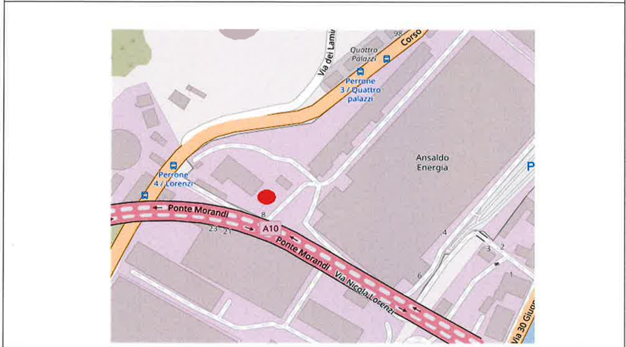
Figura 1 – Postazione ponente a Nord (44.428180, 8.884375) – PPN1 – A1