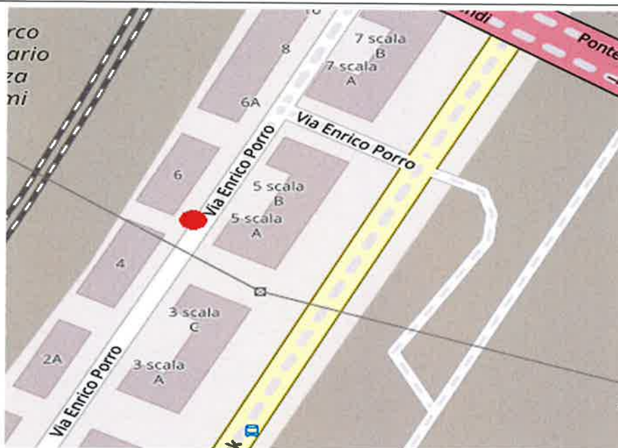
Figura 4 – Postazione levante a Sud (44.424376 N, 8.889742 E) – PPS2 – A4