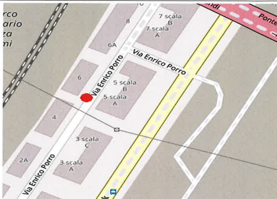
Figura 4 – Postazione levante a Sud (44.424376 N, 8.889742 E) – PPS2 – A4