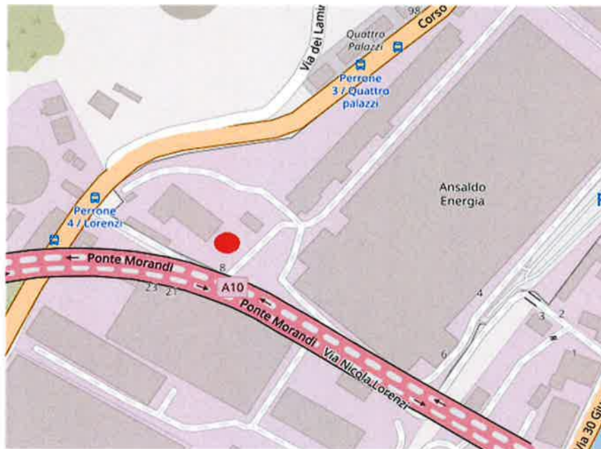
Figura 1 – Postazione ponente a Nord (44.428180, 8.884375) – PPN1 – A1