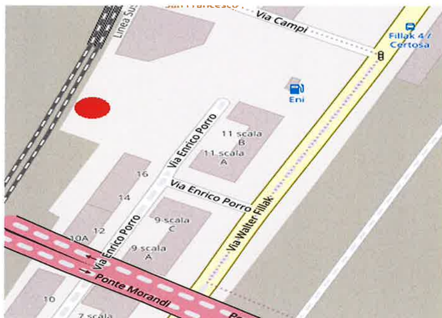
Figura 3 – Postazione levante a Nord (44.425934 N, 8.890475 E) – PPN2 - A3