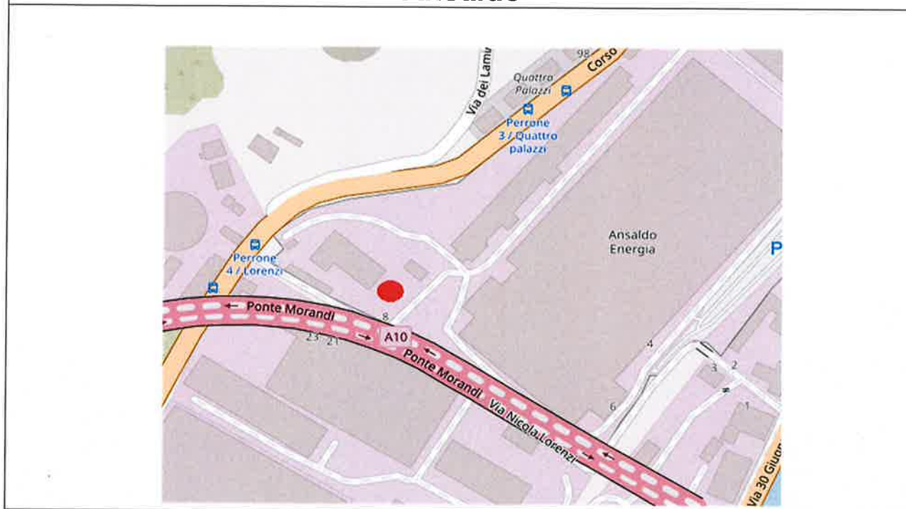
Figura 1 – Postazione ponente a Nord (44.428180, 8.884375) – PPN1 – A1