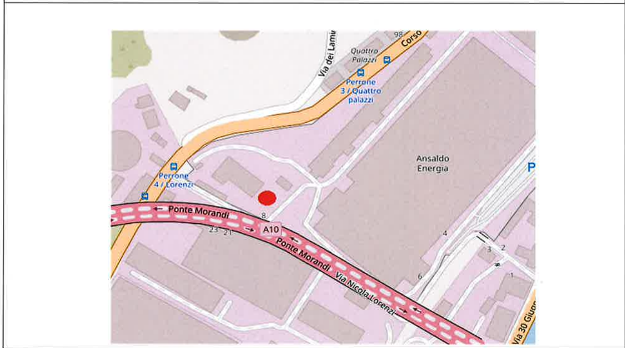
Figura 1 – Postazione ponente a Nord (44.428180, 8.884375) – PPN1 – A1