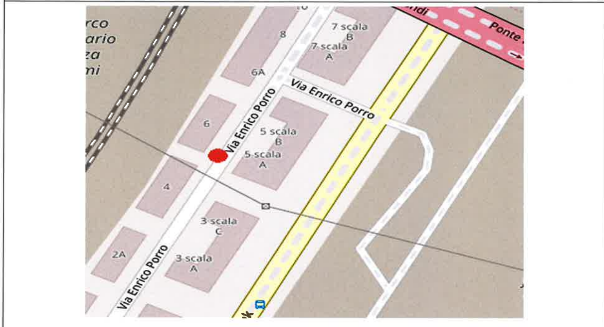
Figura 4 – Postazione levante a Sud (44.424376 N, 8.889742 E) – PPS2 – A4