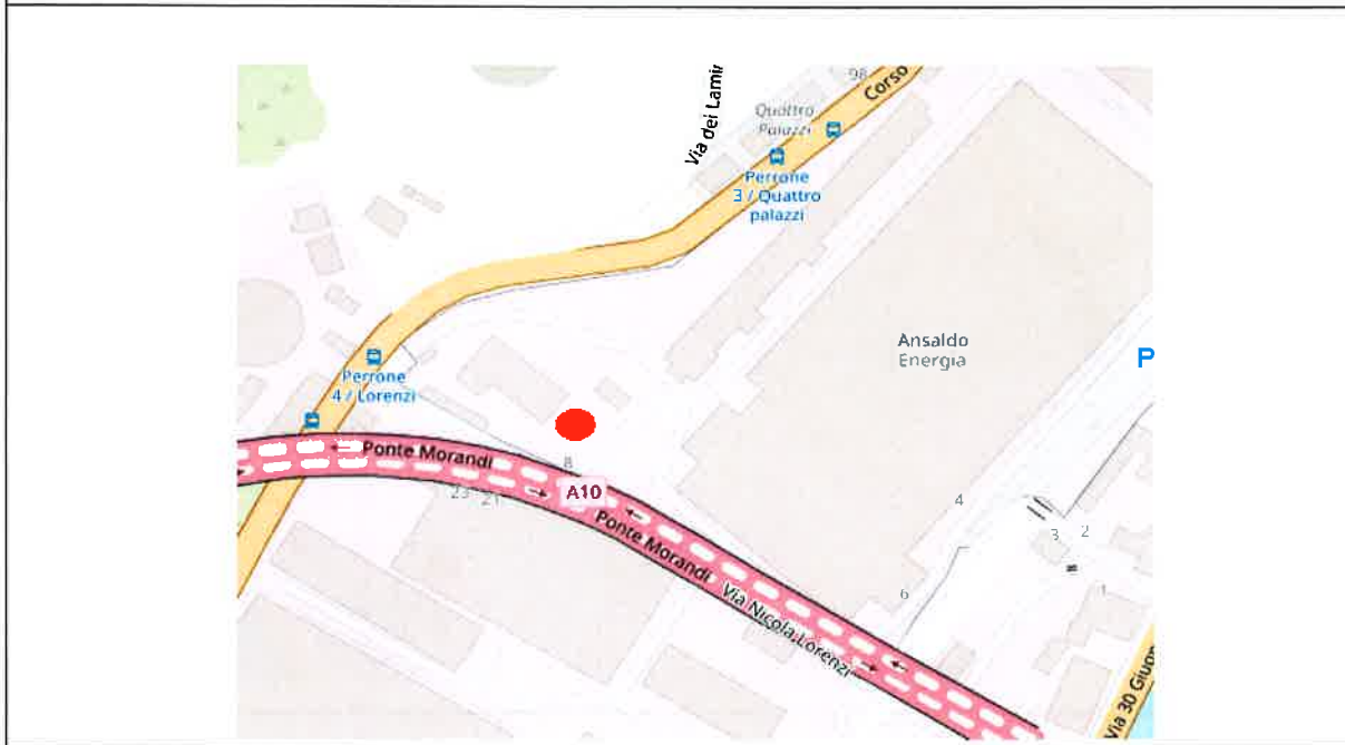
Figura 1 – Postazione ponente a Nord (44.428180, 8.884375) – PPN1 – A1