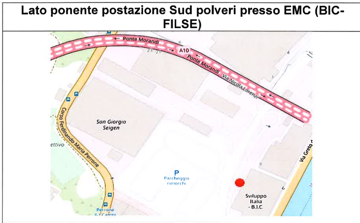
Figura 2 – Postazione ponente a Sud (44,425321 N; 8,885691 E) – PPS1 – A2