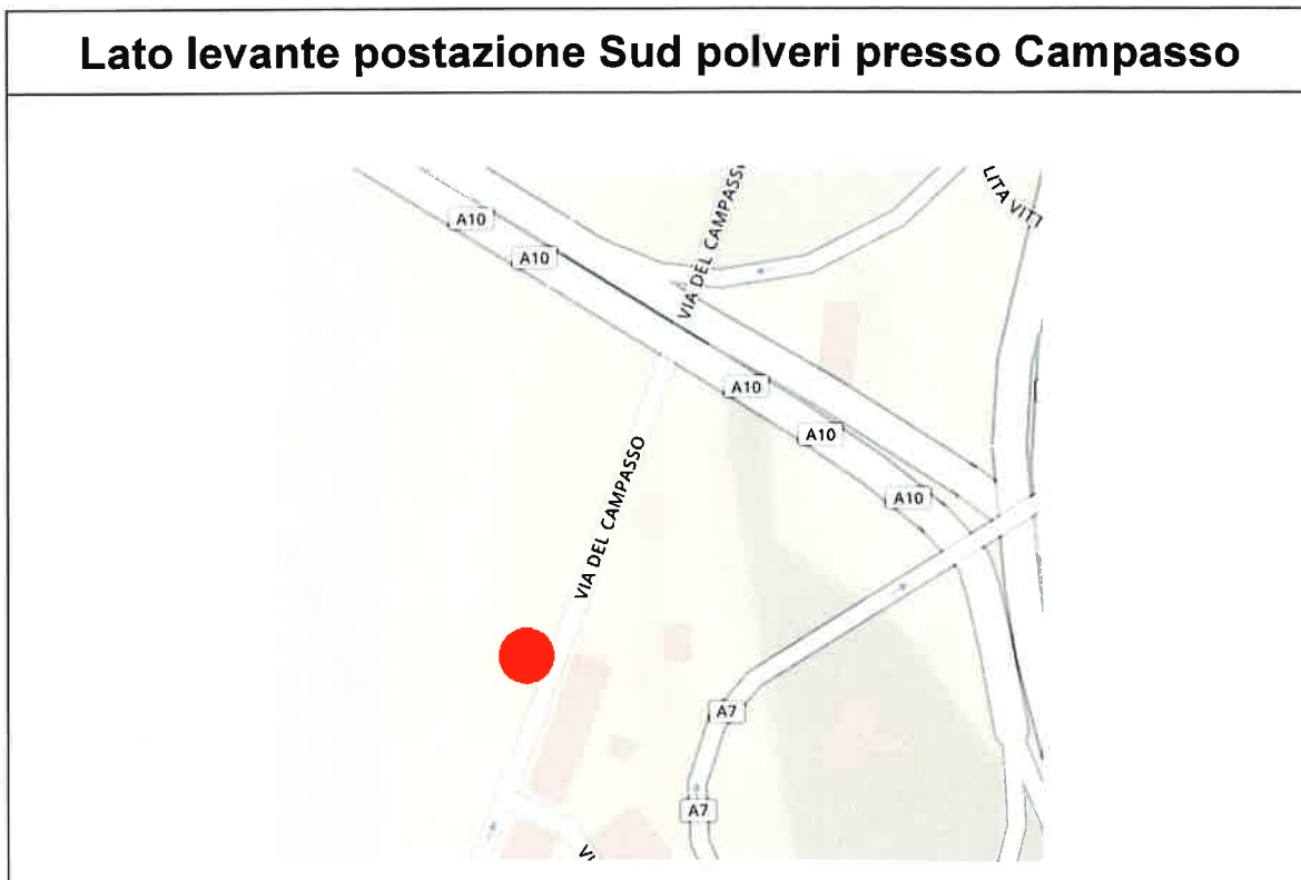
Figura 6 – Postazione levante a Sud (44.423296 N, 8.892176 E) – PPS3 – A6