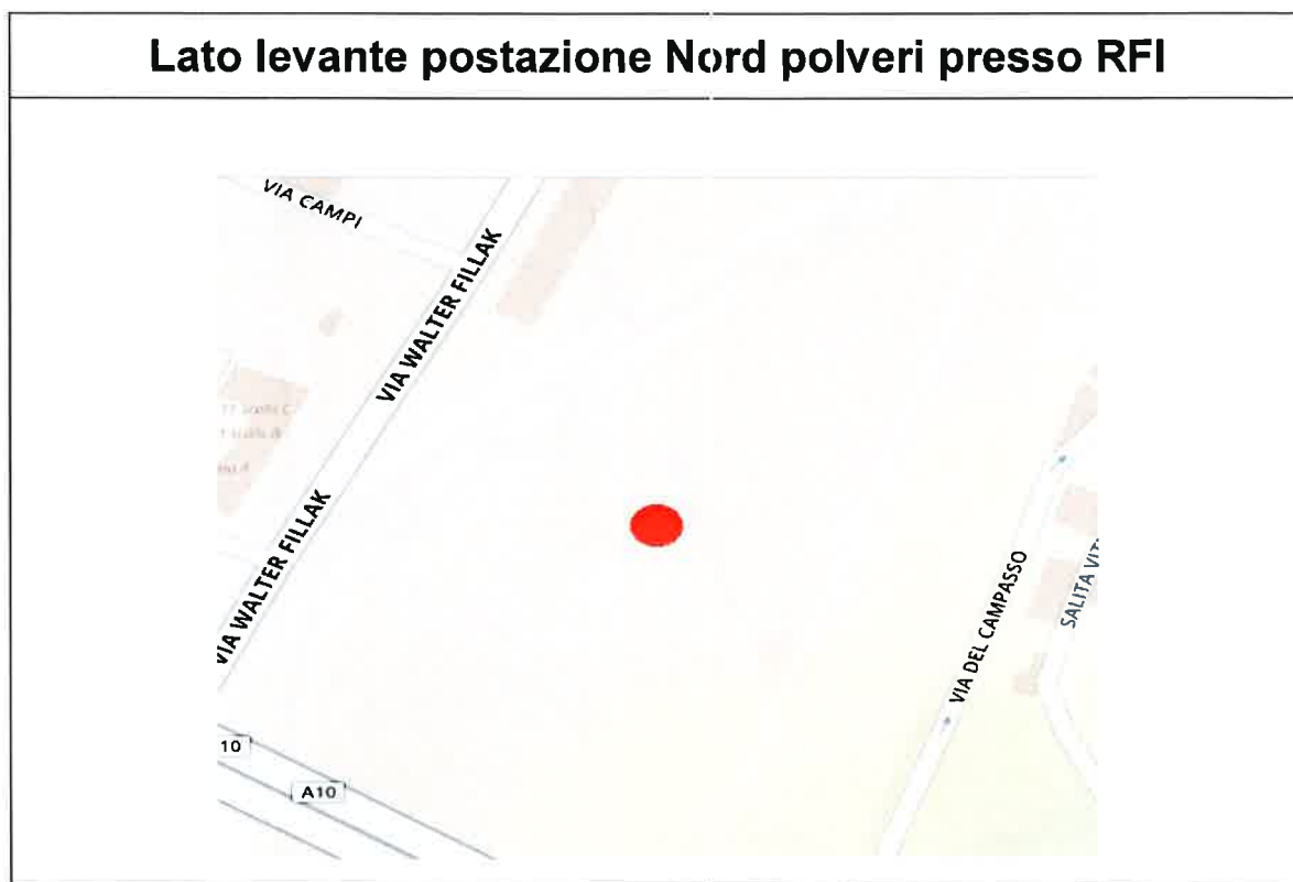
Figura 5 – Postazione levante a Nord (44.425934 N, 8.890475 E) – PPN3 – A5