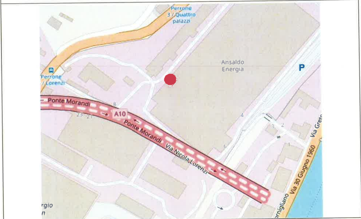
Figura 1 – Postazione a Nord (44,428416 N; 8,885691 E) – PPN1