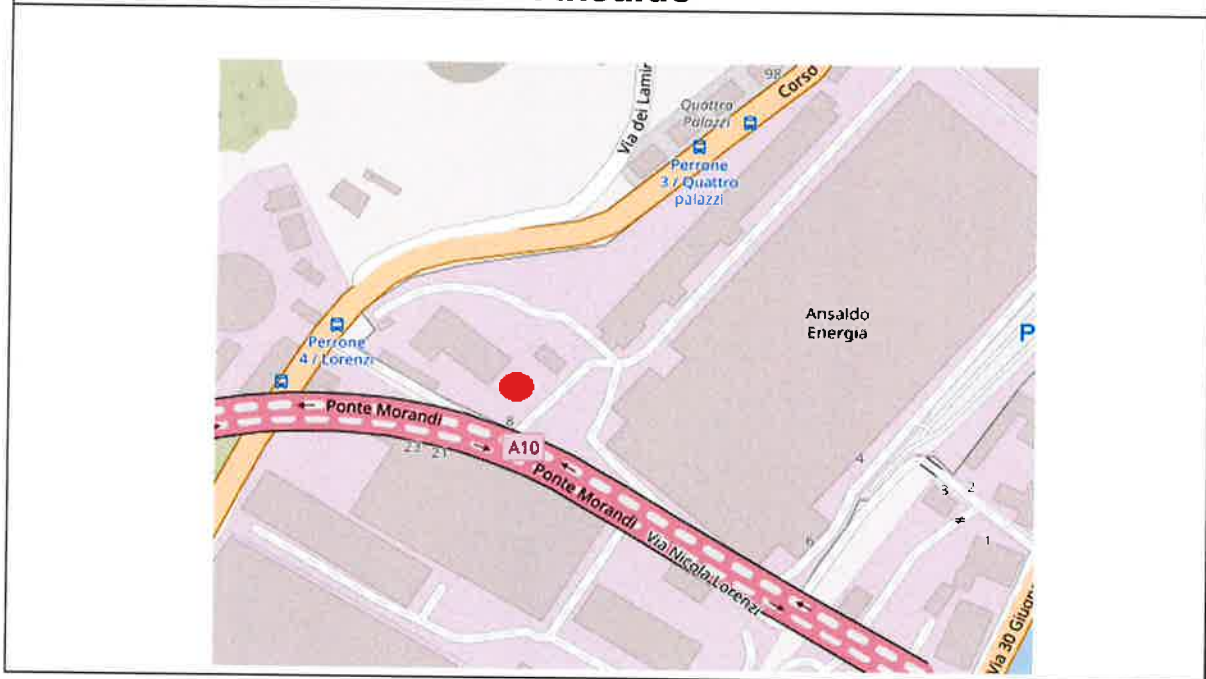
Figura 1 – Postazione ponente a Nord (44.428180, 8.884375) – PPN1 – A1