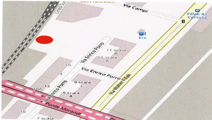
Figura 3 – Postazione levante a Nord (44.425934 N, 8.890475 E) – PPN2 - A3