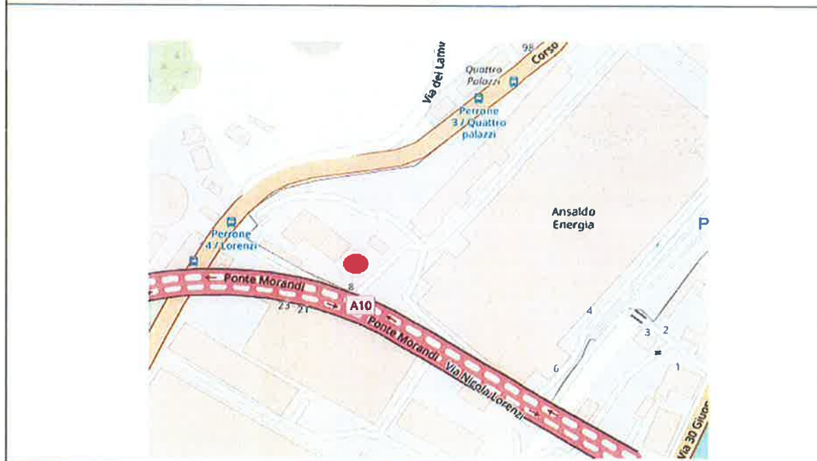
Figura 1 – Postazione ponente a Nord (44.428180, 8.884375) – PPN1 – A1