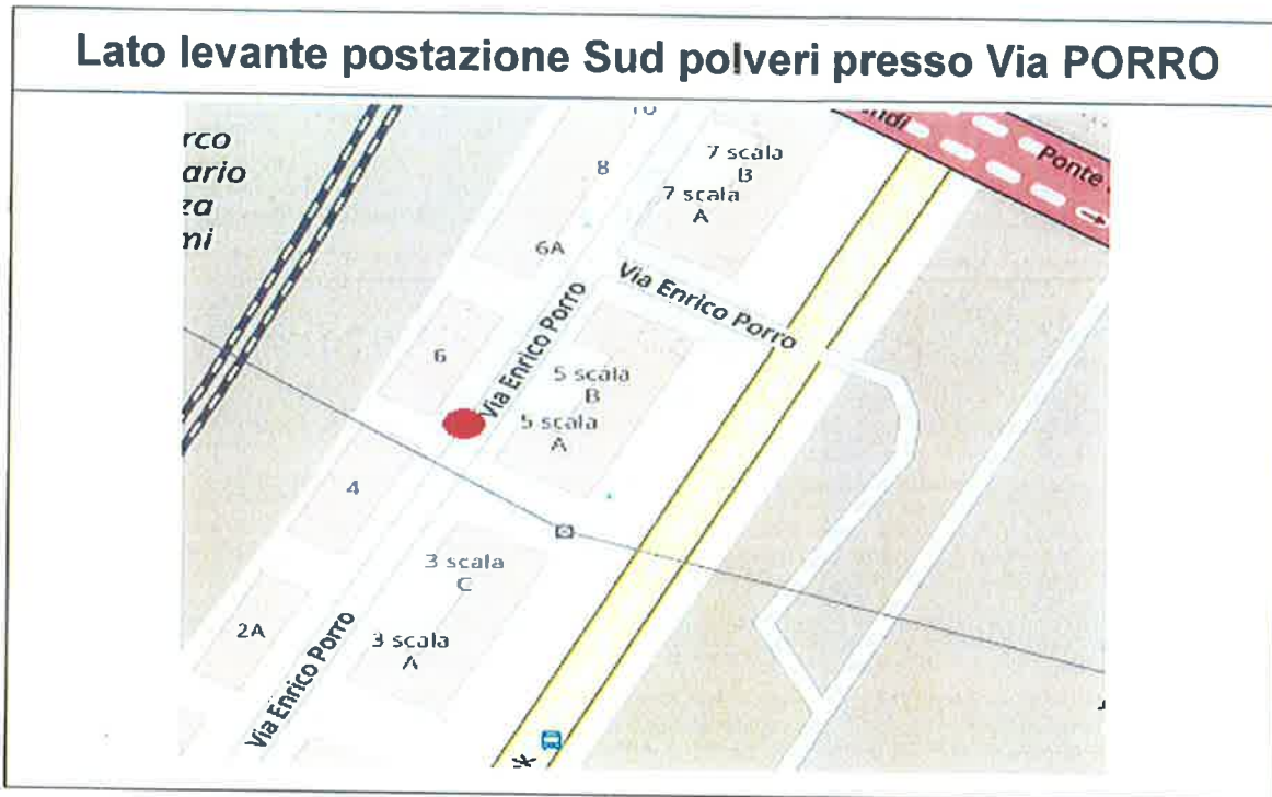
Figura 4 – Postazione levante a Sud (44.424376 N, 8.889742 E) – PPS2 – A4