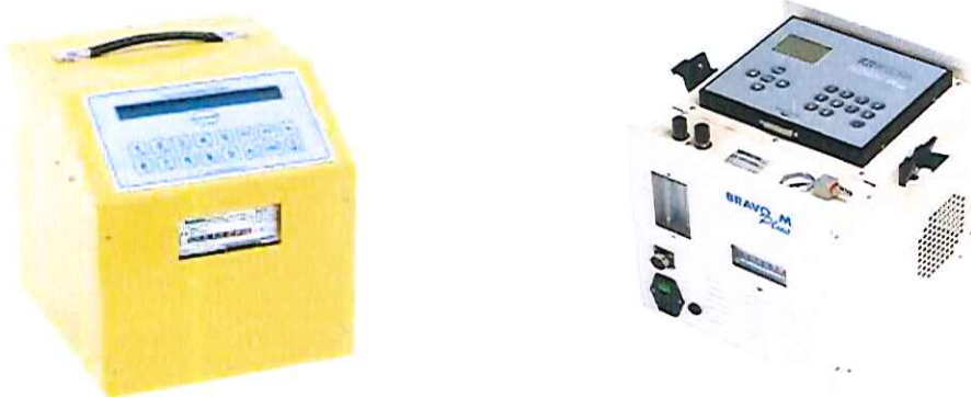
Foto n. 1 – Campionatore Megasystem Life One e Tecora Bravo Plus.